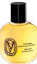
Diptyque, Voile satin, € 48

THIERRY HUGLER 1992/GUY MARINEAU, CORPS A BALEINES 1770-1780/LES ARTS DECORATIFS, DEPOT DU MUSEE DE CLUNY