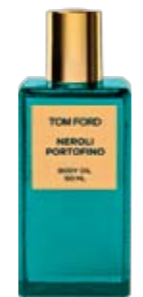
Tom Ford, Neroli Portofino, € 115