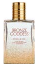
Estée Lauder, Bronze goddess, € 50