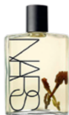
Nars, Monoi body glow, € 48,50

Μία από τις απολαύσεις του καλοκαιριού είναι τα λάδια σώματος που ενυδατώνουν την επιδερμίδα και χαρίζουν το πιο υπέροχο άρωμα! Παραθέτουμε το top 5 της αγοράς... [Κ.Β.]