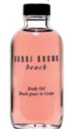
Bobbi Brown, Beach body oil, € 39